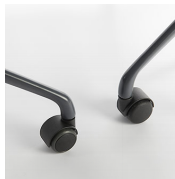
Ruedas / XK Ruedas duras o blandas.