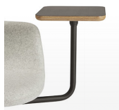
Pala escritorio / XK