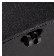
Ruedas / TO