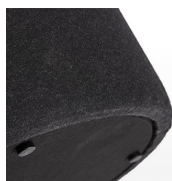
Tacos / TO