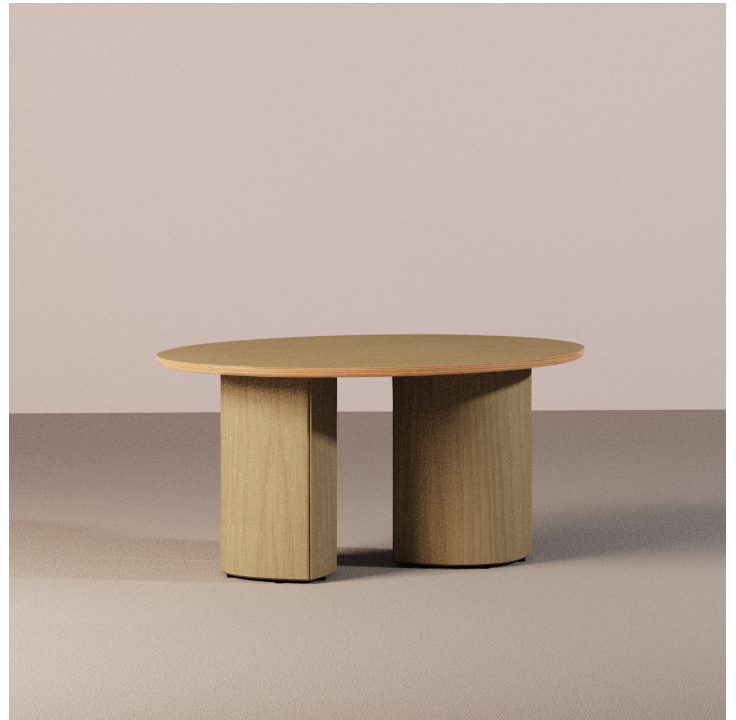
TABLE AUXILIAIRE DOUBLE COLONNE EN BOIS :

Base en plaque d'acier de 10 mm d'épaisseur découpée au laser.