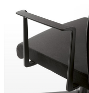
Brazo fijo poliamida / MG