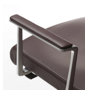
Apoyabrazos tapizado en piel / MG