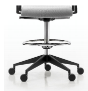
Pistón alto y reposapiés / MG