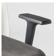
Brazos regulables / MG 2D o 3D