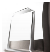
Brazo fijo aluminio / MG Pulido o pintado.