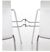
Pieza de unión / KB