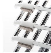
Tacos fieltro remachados / KB