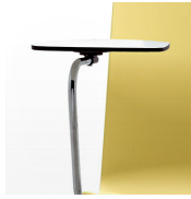
Pala escritorio / KB Pala escritorio en compacto facilmente desmontable.