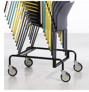
Carro apilamiento / KB