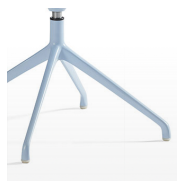
Base en aluminium / KB Peint, chromé ou gloss.