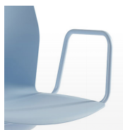
Accoudoirs fermés / KB Peint, chromé ou gloss.