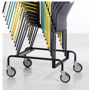
Carro apilamiento / KB