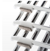
Tacos fieltro remachados / KB