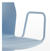
Accoudoirs fermés / KB Peint, chromé ou gloss.