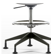
Vérin plus long et repose-pieds / KB