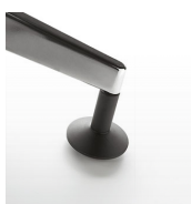
Topes deslizantes / KB