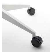
Ruedas duras / KB