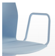
Brazos cerrados / KB Pintados, cromados o gloss