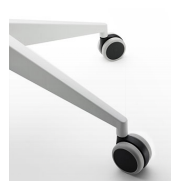
Ruedas blandas / KB