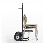
Chariot de rangement / KB