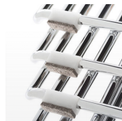
Tacos fieltro remachados / KB