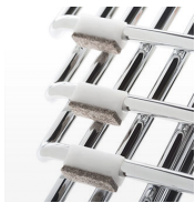
Tacos fieltro remachados / KB