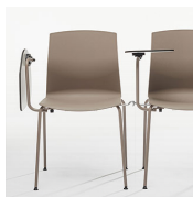
Pala escritorio / KB Pala escritorio en compacto facilmente desmontable.