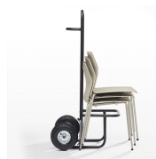
Carro apilamiento / KB