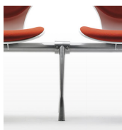
Pies intermedios / GKB En aluminio pintado o pulido.