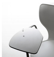
Mesa auxiliar / GKB