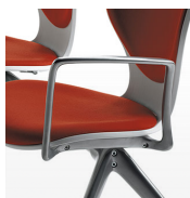
Brazos de aluminio / GKB Pintados o pulidos.