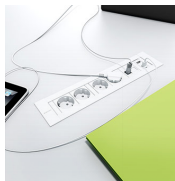
Électrification / CRF Kit electrificación sobre encimera