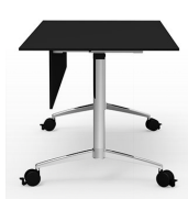
Voiles de fond / CRF