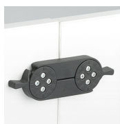
Pieza de unión / CRF