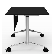
Faldones / CRF