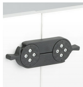
Pieza de unión / CRF