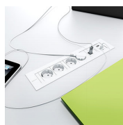
Kit electrificación / CRF Kit electrificación sobre encimera