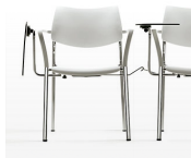
Pala escritorio / BR Pala escritorio en compacto desmontable sin necesidad de herramienta.