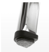
Tacos fieltro / BR