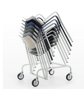
Carro de apilamiento y transporte / BR