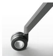
Roulettes dures / AR