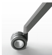
Roulettes souples / AR