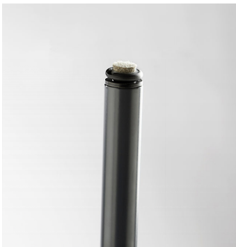
Patins avec feutre / XK