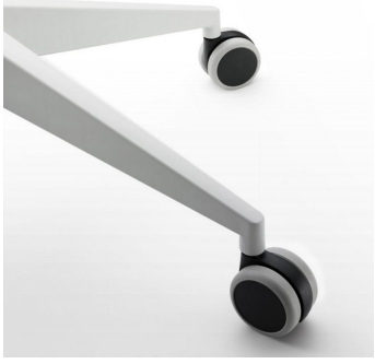
Ruedas blandas / KB