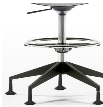
Pistón alto y aro reposapiés / KB