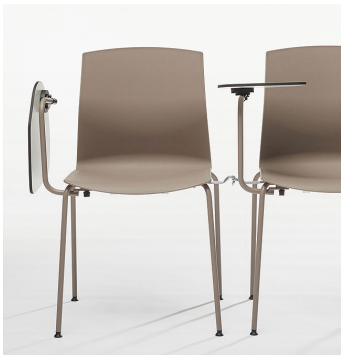
Tablette écriteire / KB Tablette écriteire en HPL facile à démonter.