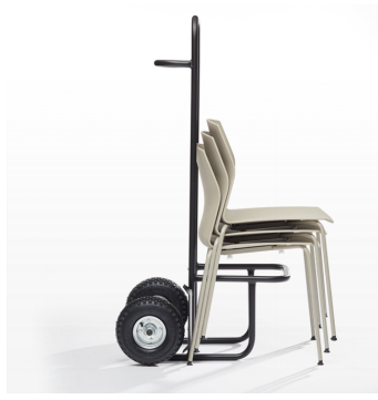
Chariot de rangement / KB