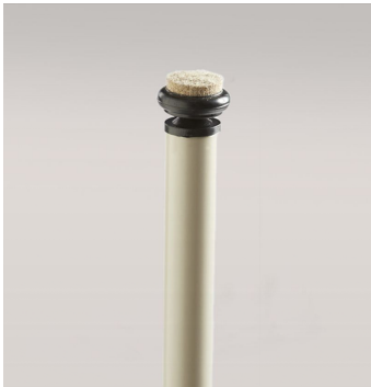
Patins Feutre - ACT1