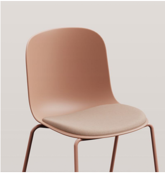
"Extra Soft" - AC102 / AC103 Assise ou complètement tapisée "extra soft".