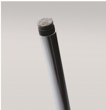
Patins Feutre - 270/A