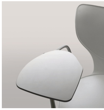
Tablette Écriteire - 263D/263I Tablette écritoire en compactmel blanc ou noir sur accoudoir.