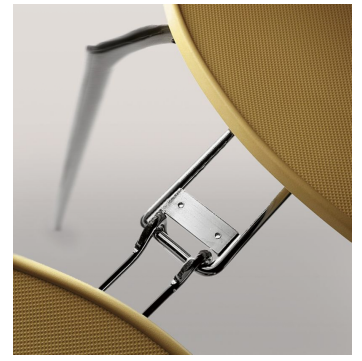
Pièce d'union Pièce d'union télescopique, dissimulée sous le siège.