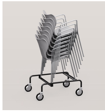
Chariot pour Transport et Stockage - 264/A 14 unts non tapissé / 12 unts tapissé Cette goulotte sera peint en noir, sauf que le client indique un autre coloris du nuancier AKABA.