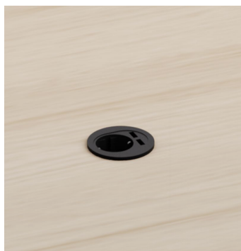
Chargeur USB - AC083 Ø70mm en support / Ø60mm en découpe. 1 schuko + 1 USB chargement A et C. Couleur noir.