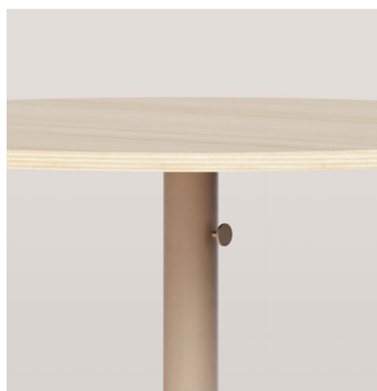
Patère - AC058 Deux par colonne.