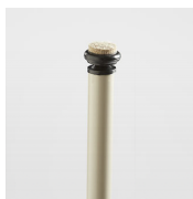
Patins feutre / Al