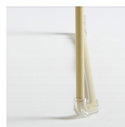
Patins feutre rivetés / AD