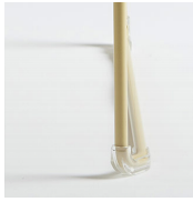
Tacos fieltro remachados / AD