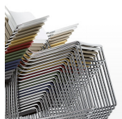
Chariot pour le rangement et le transport / AD