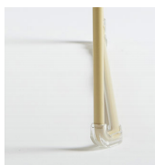
Patins feutre rivetés / AD