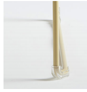
Tacos fieltro remachados / AD