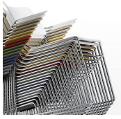
Carro para apilamiento y transporte / AD