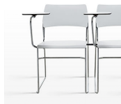
Pala escritorio y pieza unión / AD Pieza de unión oculta bajo asiento. Pala escritorio en compacto desmontable sin necesidad de herramienta.