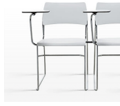
Pala escritorio y pieza unión / AD Pieza de unión oculta bajo asiento. Pala escritorio en compacto desmontable sin necesidad de herramienta.