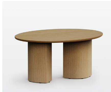
Wooden Base (2) Base Madera