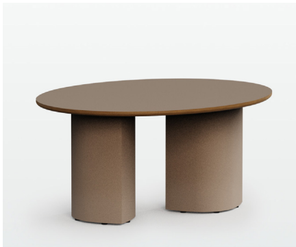
Powder coated Base (1) Base Pintada